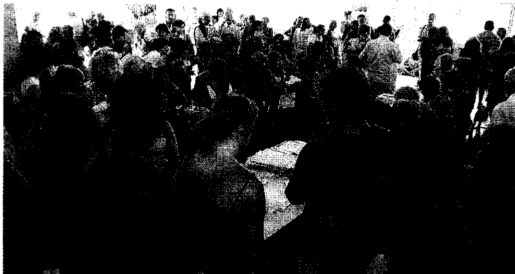
Sopra precari in attesa alla sala-chiamate delle Guidobono e sotto i tabelloni con l'elenco delle cattedre